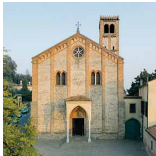
Sopra, la veglia pasquale 2013 dei giovani al Duomo. La prossima sarà l'11 aprile. A sinistra, il duomo vecchio di Monselice. Sotto, alunni della primaria Sacro Cuore.